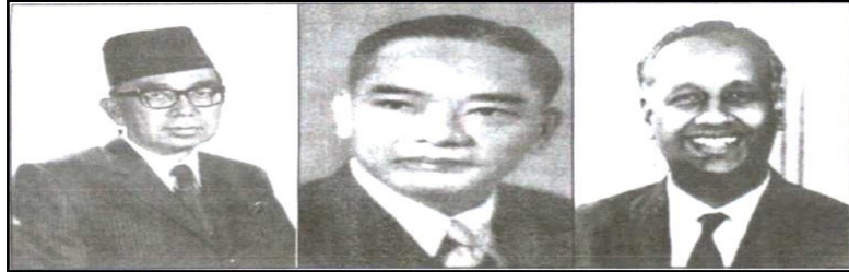
Tun Haji Abdul Razak Tun H.S. Lee Tun V.T. Sambanthan